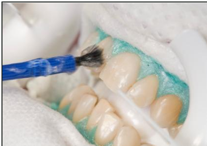
Nachdem das Zahnfleisch mit einem Schutz abgedeckt wurde, kommt das Bleaching-Gel auf die Zähne

Wie beim Home-Bleaching müssen die Zähne zuerst untersucht werden: Wenn sie Löcher, Risse oder undichte Füllungen haben, kann es beim Bleaching Probleme geben. Dann werden die Zähne gründlich gereinigt. Nur so kann das Bleaching-Gel richtig wirken. Bevor das eigentliche Bleaching beginnt, muss das Zahnfleisch mit einem speziellen Schutz abgedeckt werden.