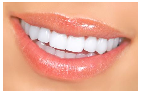
Power-Bleaching: Sichtbar hellere Zähne nach einer Stunde

Was kann man tun, wenn nur ein einzelner Zahn dunkel ist? Auf der nächsten Seite finden Sie Informationen zur Einzelzahn-Aufhellung!